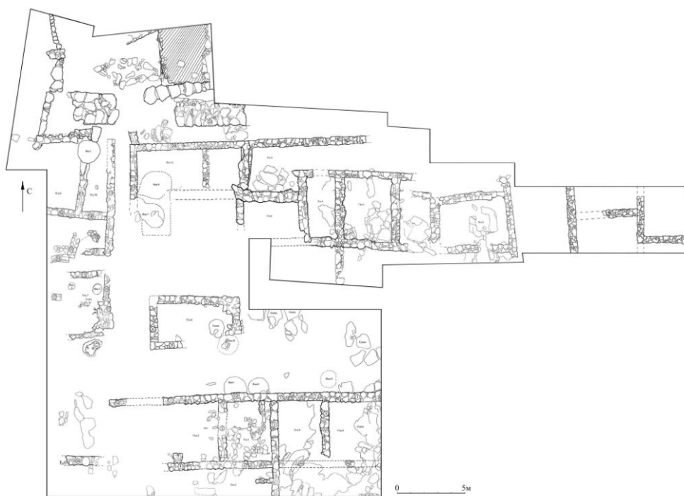
Рис. 3. Казантип Западный (Мысовое)

Столь «пёстрый» набор (особенно клейма и чернолаковая посуда) вносят заметные разночтения в предлагаемые общие датировки памятника. Похоже, некое поселение, облик которого нам неведом, существовало здесь в последней трети V в. до н.э. Затем, где-то через полстолетия, тут был построен весьма сложный по планировке и значительный по площади населённый пункт, напоминавший т.н. коллективные усадьбы. В первой трети следующего века он был дополнительно укреплен. И в таком виде просуществовал ещё примерно полтора-два столетия (рис. 3) (А.А. Масленников, 2010, с. 206).